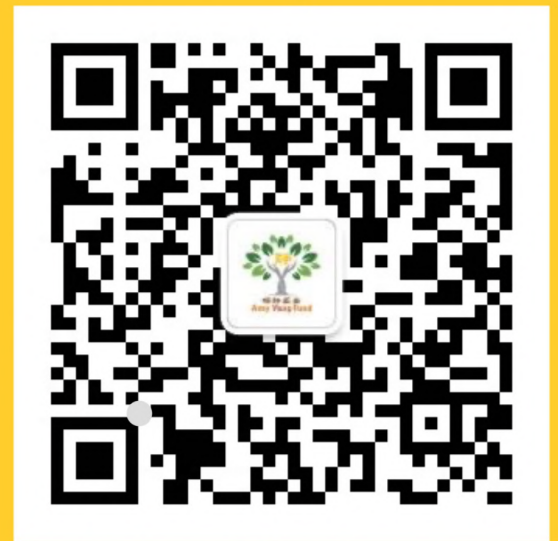
Qr code of the Amy Yang Fund